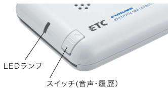
LEDランプ スイッチ(音声・履歴)